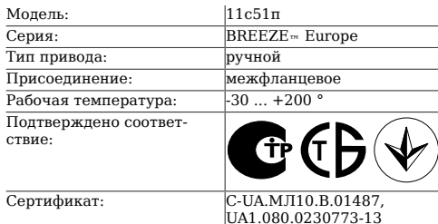
Таблица 1. Характеристики