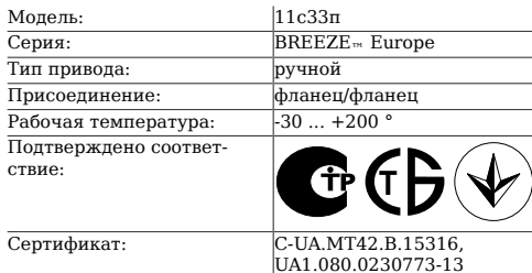
Таблица 1. Характеристики