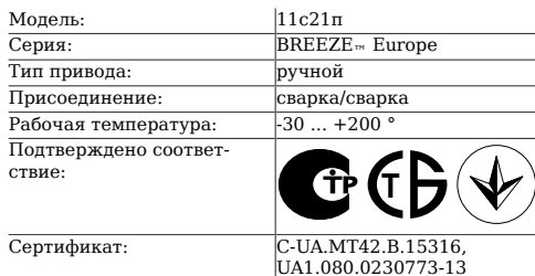
Таблица 1. Характеристики